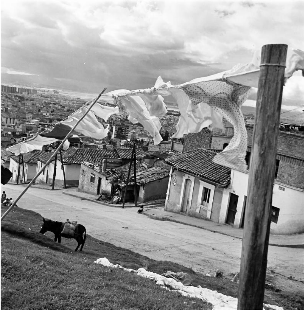
Daniel Rodríguez, Calle 33 con Cra. 3 , 1940

Clothesline in La Perseverancia neighborhood, a working-class neighborhood located on the Eastern Mountains of Bogotá. This neighborhood, created to provide housing for the workers of the locally famous Bavaria Brewery, ended up being one of the most politically active urban areas during the twentieth century.