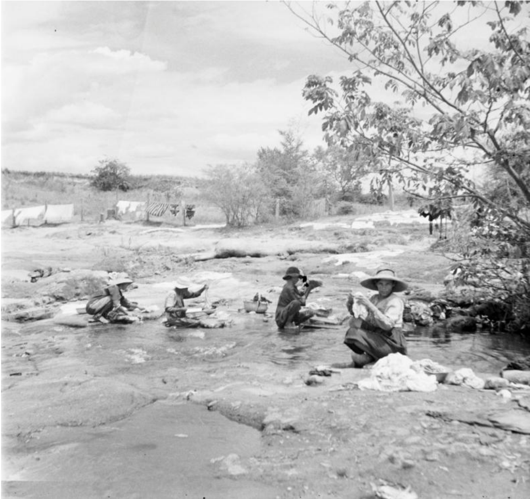
Saúl Ordúz, Lavanderas , 1950

Female laundry workers scrubbing clothes against the rocks of a calm river. Location was an important issue for female laundry workers. In certain spots, they could enjoy rocks better suited for scrubbing, and cleaner water, which meant easier working conditions and more rewarding results. The appropriation of the environment was also important in laundry work. Barbed wire fences used as clotheslines show this appropriation, but also evidence the role of sun and wind for traditional laundry.