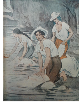
Eugenio Zerda, "Lavanderas", El Gráfico , June 23, 1923, cover

Drawing by the Colombian artist Eugenio Zerda (1879-1945), showing a group of female laundry workers with hats and headscarves rubbing clothes against the rocks of a river. This drawing was published in a cover of the magazine El Gráfico , which along with the magazine Cromos are important sources for the graphical history of Bogotá.