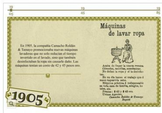
Reclamo: Dominio público. Infografía: Mónica Páez Pérez y María José Castillo Ortega. Tangrama, 2013.

(haga click aquí para ver la línea de tiempo en una ventana nueva)