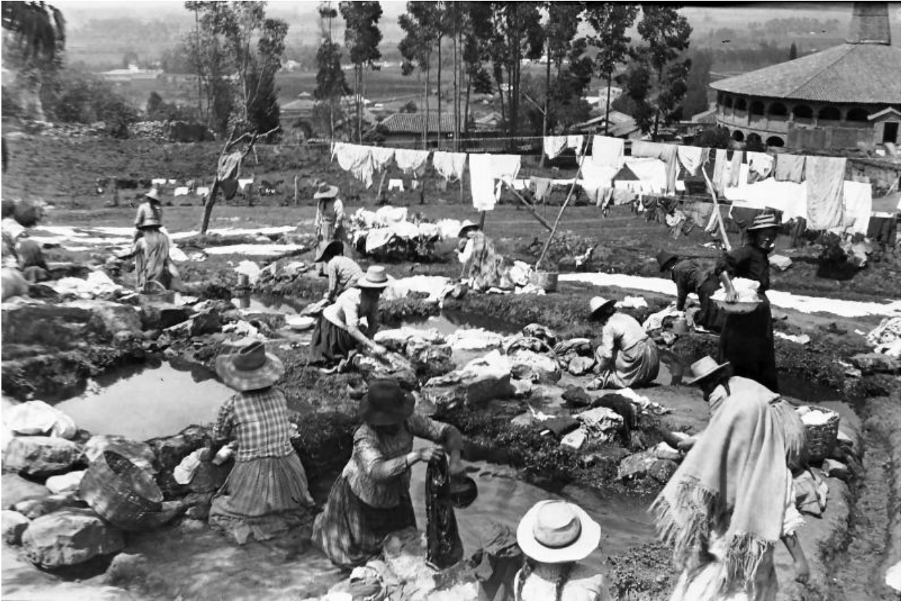
Luis Alberto Acuña, Lavanderas (Female laundry workers), 1910

All rights reserved. Acuña, Luis Alberto. Lavanderas (1910). Courtesy of Museo de Bogotá. Instituto Distrital de Patrimonio Cultural. Washerwomen washing clothes in small ponds built on the bank of a river. They are surrounded by clotheslines and baskets to carry the laundry.