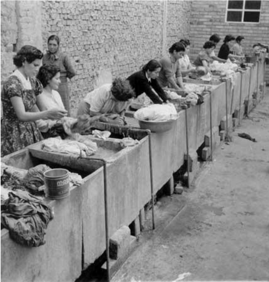
Manuel H. Rodríguez Corredor, Lavaderos Comunes , 1960

Women wash clothes in public laundry washbasins made from cement. Each washbasin has a rough surface to scrub clothes and a tank filled with water from a faucet. The public laundry washbasin was an interesting technoscientific device facilitating the transition from the collective tradition of washing clothes in rivers towards the private ritual of the home washing machine.